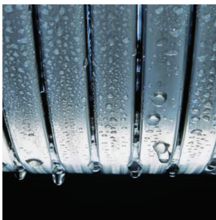
Výhřevná plocha Inox-Radial