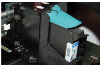
Standard HP45 kartridže