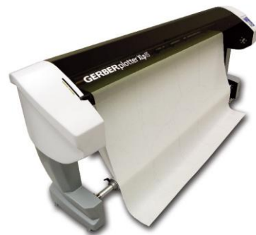
Mód „Spouštění papíru na podlahu“

Gerber Technology, Tolland, CT 06084 USA - Tel: +1(860) 871-8082 www.gerbertechnology.com - info@gerbertechnology.com Zastoupení pro ČR www.zadas.cz – zadas@zadas.cz tel. 00420 582 300 280