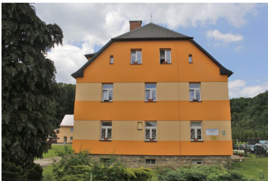
Místo poskytování pobytové sociální služby v Kobylé nad Vidnavkou č. p. 153