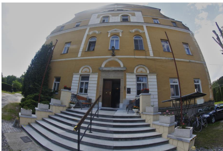
Místo poskytování pobytové sociální služby v Kobylé nad Vidnavkou č. p. 58