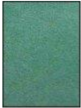
č213,kat II broušená kůže imitace