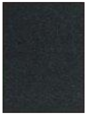
č212,kat II broušená kůže imitace