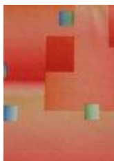
2 mikrofade 254_