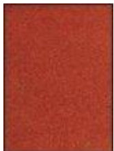
č217,kat II broušená kůže imitace