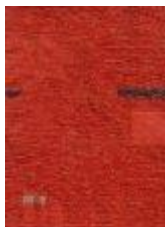
2 žinilka 205_