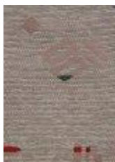
2 žinilka 206_