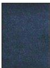
č211,kat II broušená kůže imitace