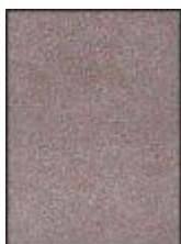
č209kat II broušená kůže imitace