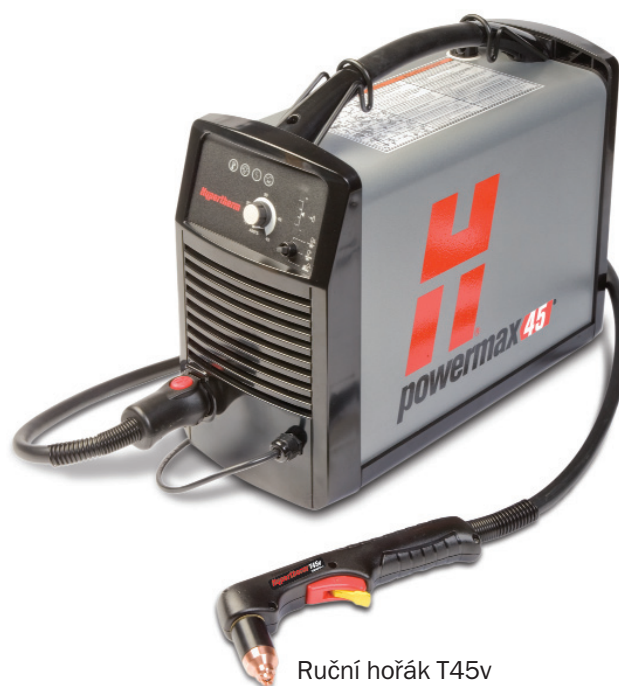
Ruční hořák T45v