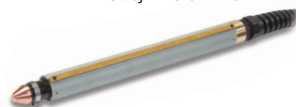
Strojní hořák T45m